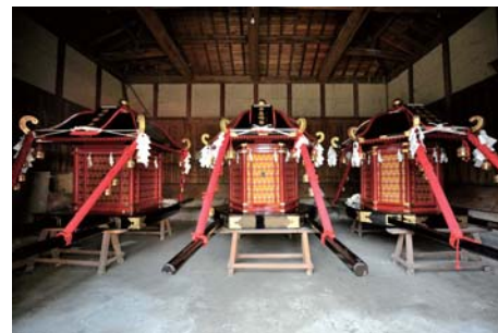
山口祇園祭のお神輿 (2015年撮影)

新型コロナウイルス感染症が蔓延して以降、3年目の夏を迎えます。このような困難な状況においても、室町時代より続く山口祇園祭は、試行錯誤しながら、たくさんの人たちの手によって、未来に向かって継承されています。祇園祭が開催される間、「口伝伝承」ということに思いをはせながら、特別な時間を過ごしたいと考え、ハレをテーマに展覧会を開催します。7月23日(土)は伝承遊びの体験講座と、とっておきの美味しい料理と飲み物を提供する夜市を開催します。